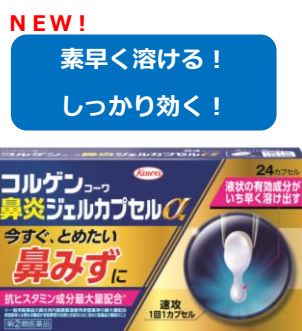
コルゲンコーワ鼻炎ジェルカプセルα