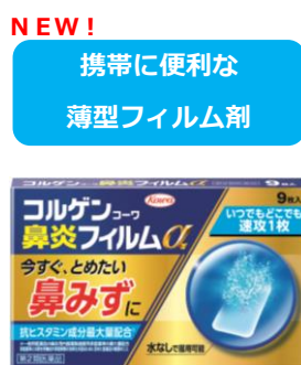
コルゲンコーワ鼻炎フィルムα