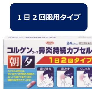
コルゲンコーワ鼻炎持続カプセル